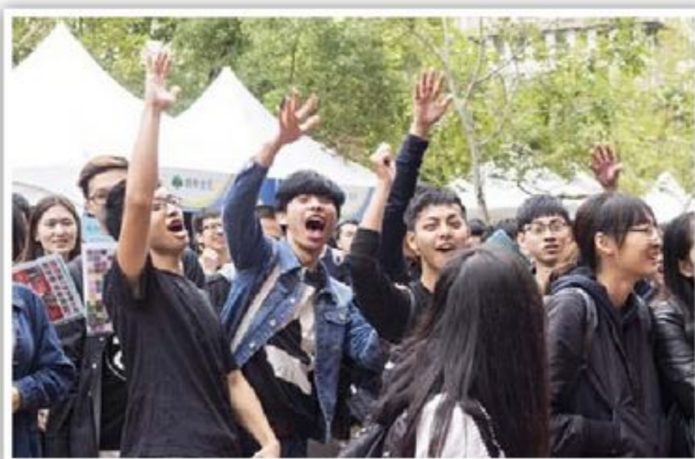
參與四維道的同學反應熱烈。

為了讓活動成效更好，依據前年同學與企業的回饋意見，商學院在企業講座主題、企業咖啡廳交流時間設計上做了調整。例如為了避免同產業的企業講座主題相同、內容重疊，商學院將講座聚焦在產業趨勢、國際布局、跨界合作、企業轉型、人才培育、服務／科技創新等六大主題，讓同學可以從不同的角度與面向，拼