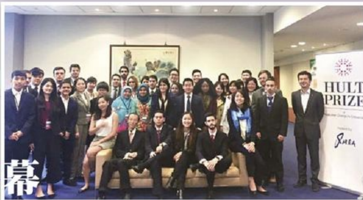
政大首次舉辦台版霍特獎，並成功晉級區域賽，之後有望與世界各地的菁英共同角逐2017霍特獎冠軍。