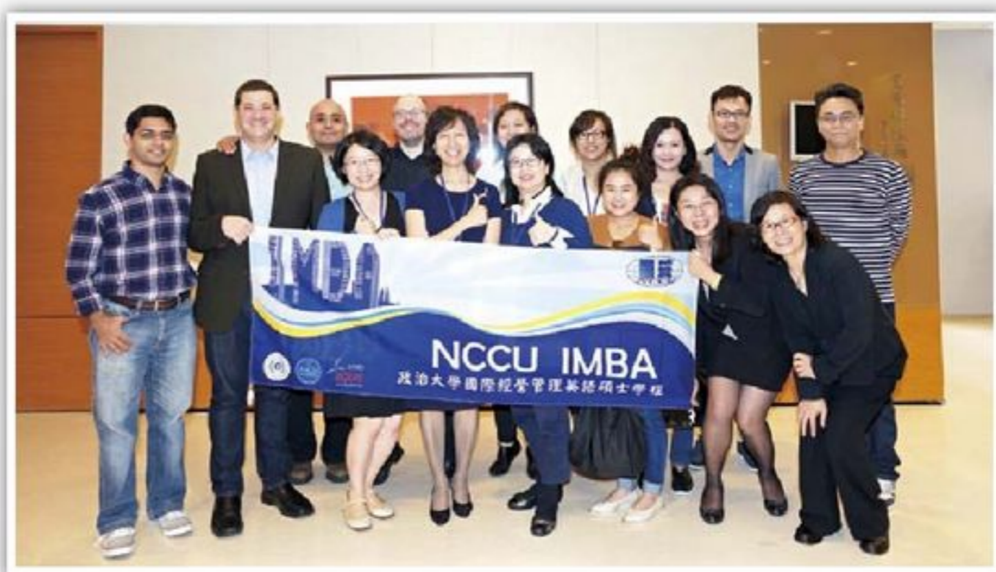
政大IMBA 2017年度招生說明會，在IMBA工作人員、在校學生以及校友們的大力支持下順利落幕。

政大IMBA 2017年招生已經開跑，為讓更多同學近距離了解政大IMBA，商學院國際事務辦公室特別在去(2015)年11月12日政大商學院元大講堂舉辦唯一一場招生說明會，當天共吸引近百位本國及外籍同學共同參與，更邀請多位校友與在校同學分享心得，現場互動熱烈。