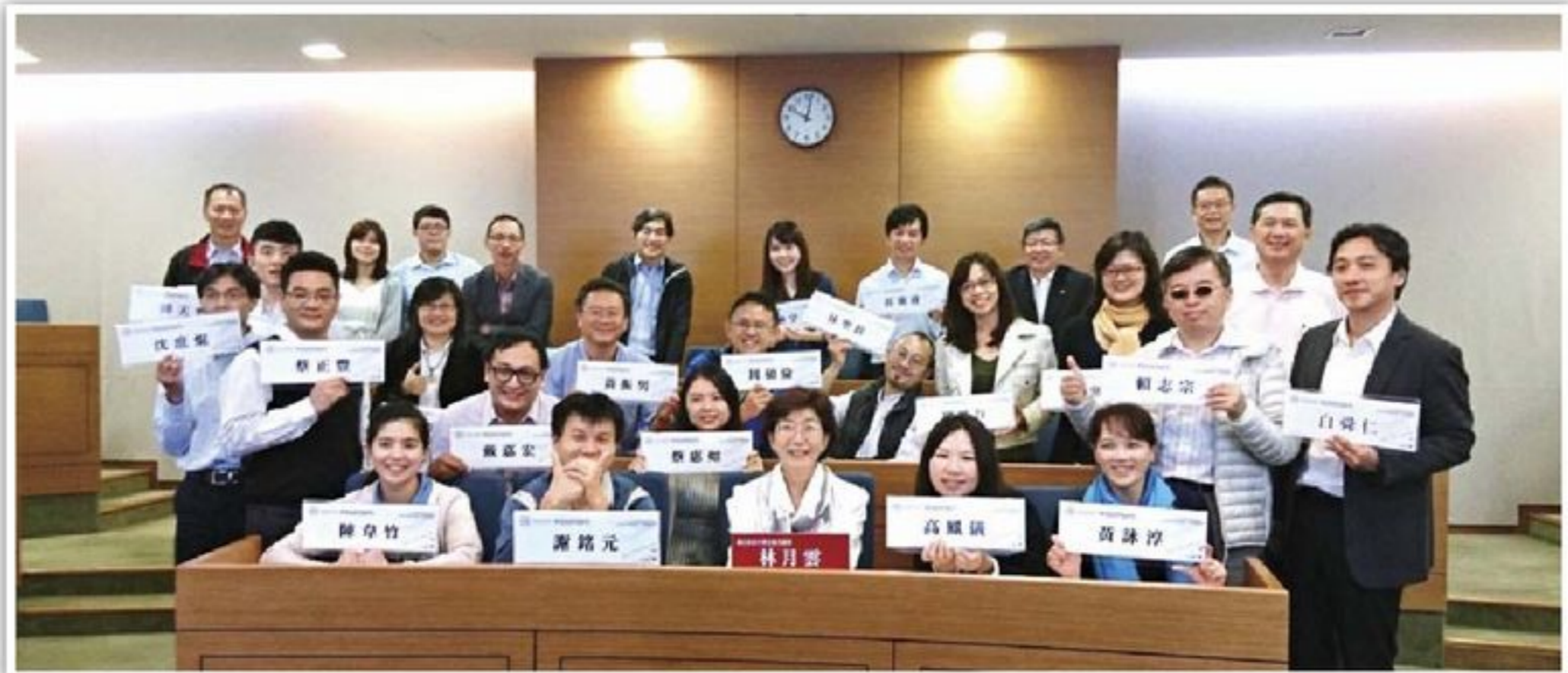
參與個案講堂的學員一同合影。

關技術日益普及、替代品（例如：智慧型手機及平板電腦）及競爭者漸增且通路商對價格敏感度漸高。