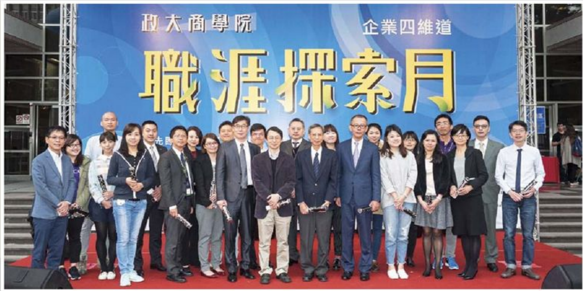
在合作企業的用心與支持下，企業四維道盛大開幕。