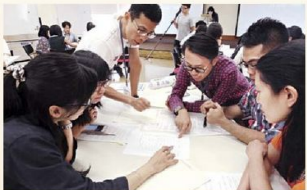
學員在小組中熱烈地進行討論。