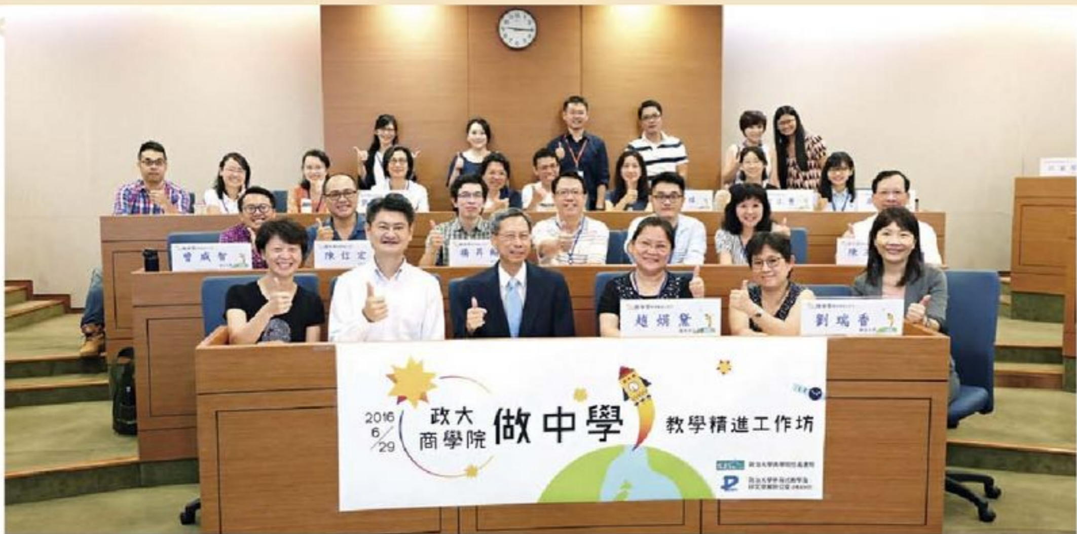
參與「做中學」教學精進工作坊的老師與學員開心合影。

僅能用有限的資源來搭建義大利麵塔，此活動讓學員體會到目標設定與策略規劃的意義以及團隊合作的重要性，並且發現創新思維往往是致勝關鍵；「競合賽局」中，別蓮蒂老師營造了決策兩難的情境，讓學員練習組內溝通以及外部協商。活動考驗學員們對於人性與道德的拿捏，過程中不時出現背叛、投機等行為決策，如同真實商業世界的縮影。本活動可應用在組織行為和公共財管理等主題，學生也能體會到組織目標應與個人目標一致，方能同時顧全個人利益並達成總體效益最大化。