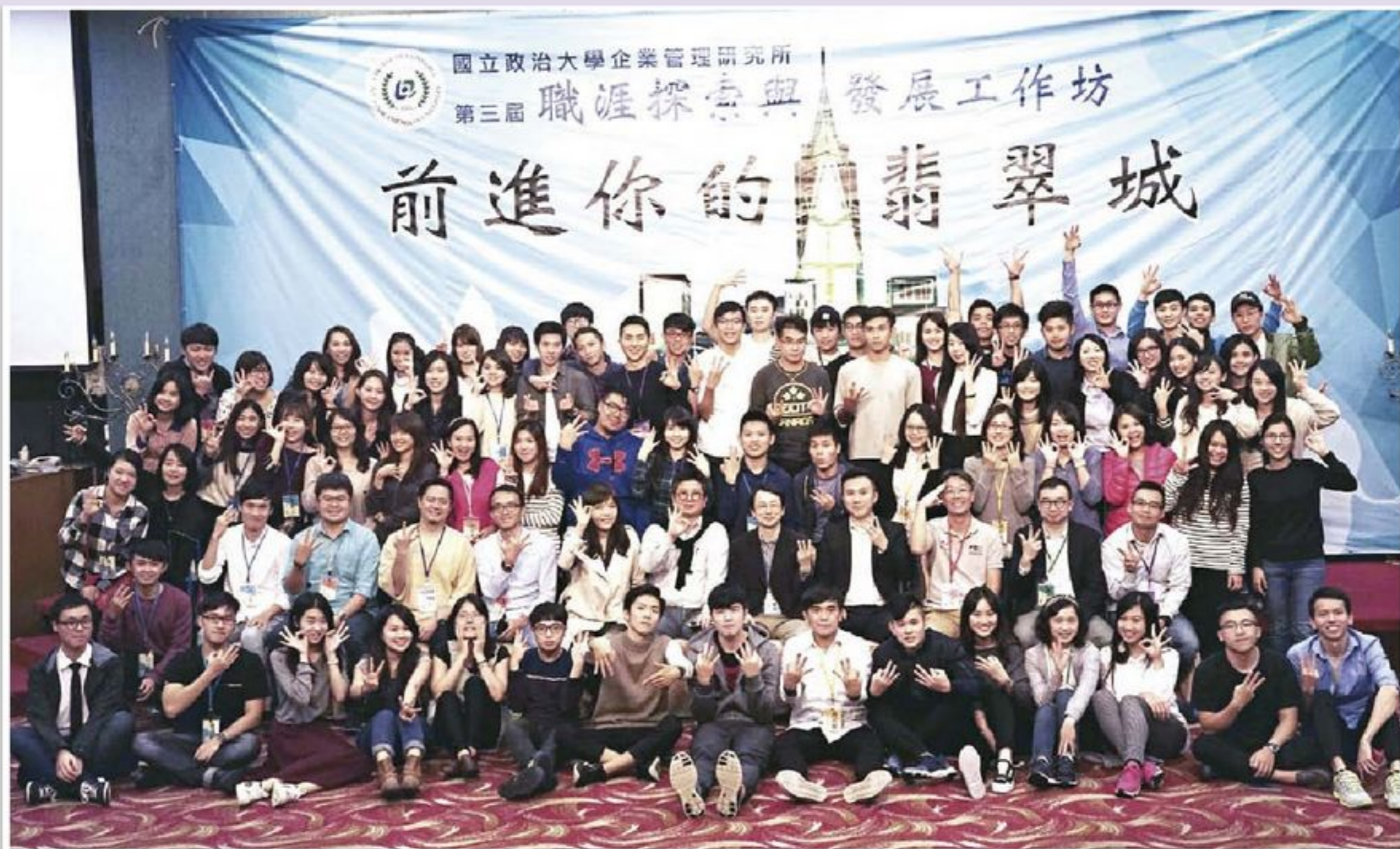
參與105學年度「職涯探索與發展工作坊」的全體師生合影。