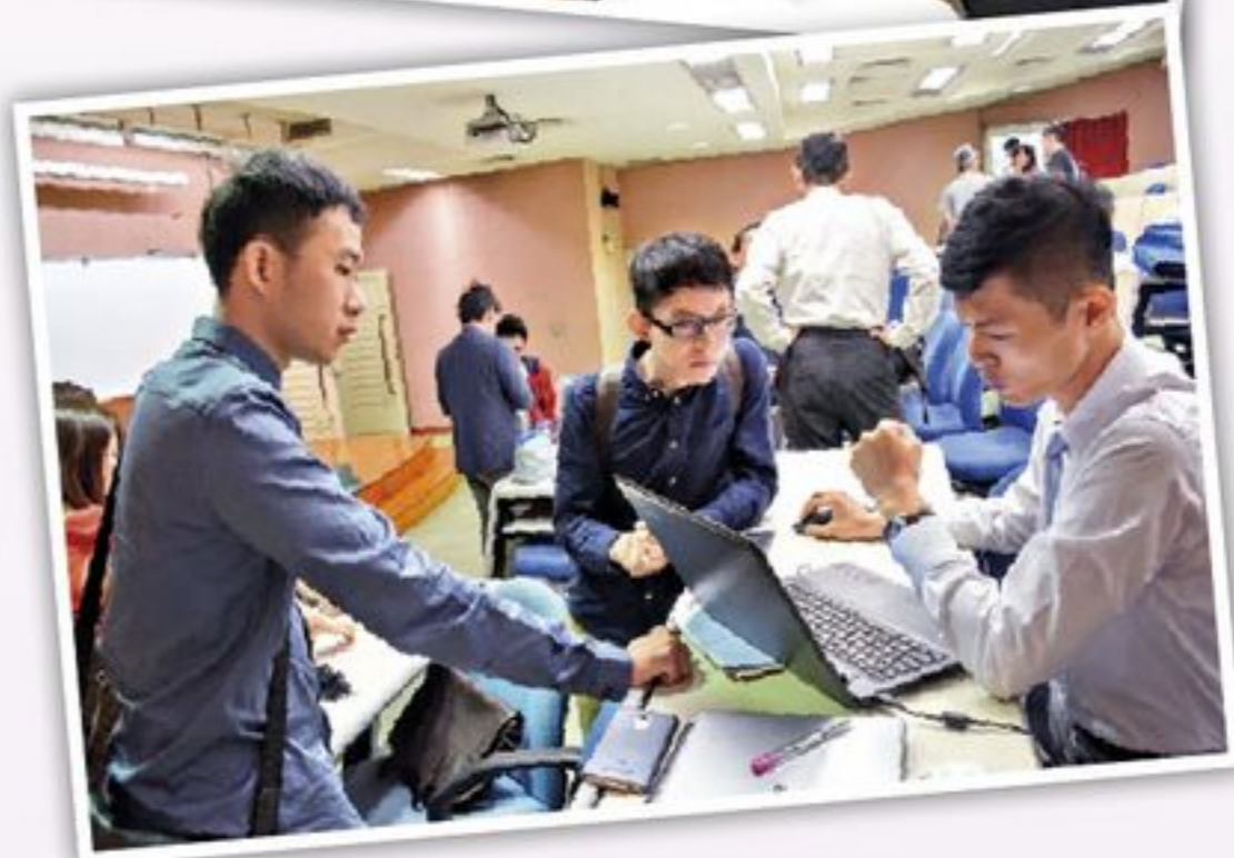
上：EMBA辦公室與EMBA班聯會聯合舉辦眾籌咖啡館。